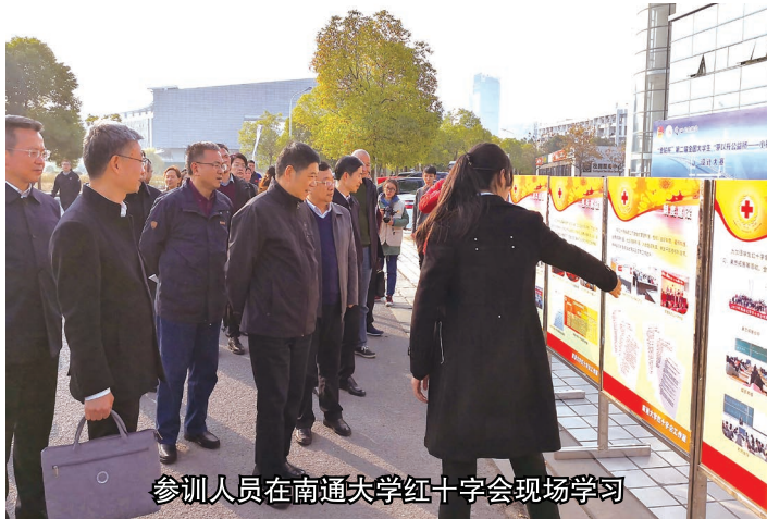
参训人员在南通大学红十字会现场学习