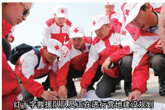
红十字救援队队员正在进行营地建设规划