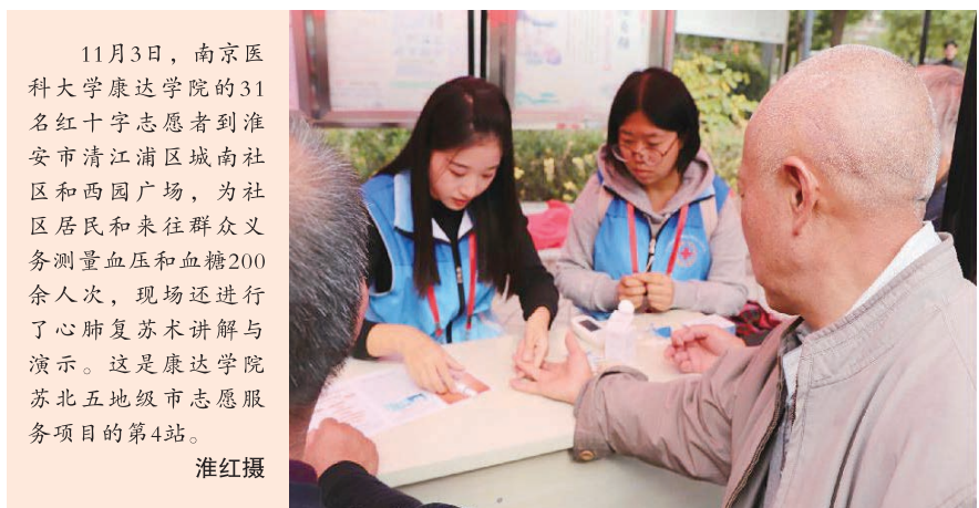
11月3日,南京医科大学康达学院的31名红十字志愿者到淮安市清江浦区城南社区和西园广场,为社区居民和来往群众义务测量血压和血糖200余人次,现场还进行了心肺复苏术讲解与演示。这是康达学院苏北五地级市志愿服务项目的第4站。