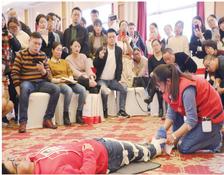
11月2日,盐城市盐都区红十字会联合区卫生计生委举办急救知识与技能培训,盐城市急救医疗中心专家和获得市急救救护技能竞赛一等奖的培训师进行理论授课和实践操作示范,来自20多家区直医疗单位和镇(区、街道)卫生院(服务中心)的160多位一线医务人员接受了专业培训,并按照比赛标准,在显示屏直观反馈和10多名师资的检测下,分组接受了心肺复苏、创伤包扎、固定等操作考核。图为培训现场。