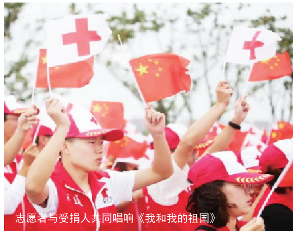
志愿者与受捐人共同唱响《我和我的祖国》

朱晋表示,在新中国成立70周年这样一个伟大而富有时代意义的时刻到来之际,捐献者们用实际行动彰显了生命的意